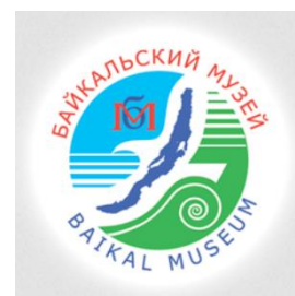
Байкальский музей СО РАН