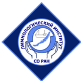
ЛИН СО РАН

Мероприятие проводится при участии и поддержке: